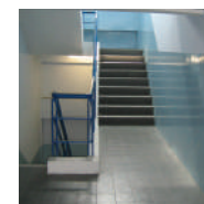
Area tangga darurat