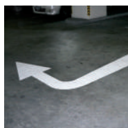
Penunjuk arah jalan