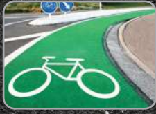
Green cycle track