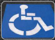
Handicapped parking space