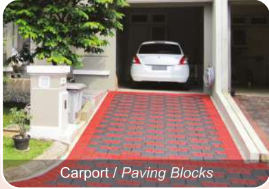
Carport / Paving Blocks