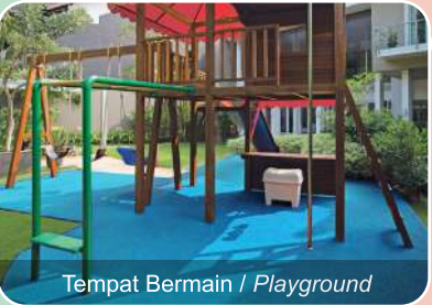
Tempat Bermain / Playground