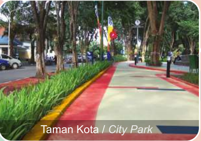
Taman Kota / City Park