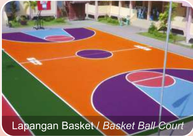
Lapangan Basket / Basket Ball Court