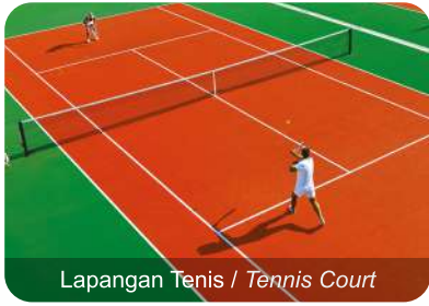
Lapangan Tenis / Tennis Court